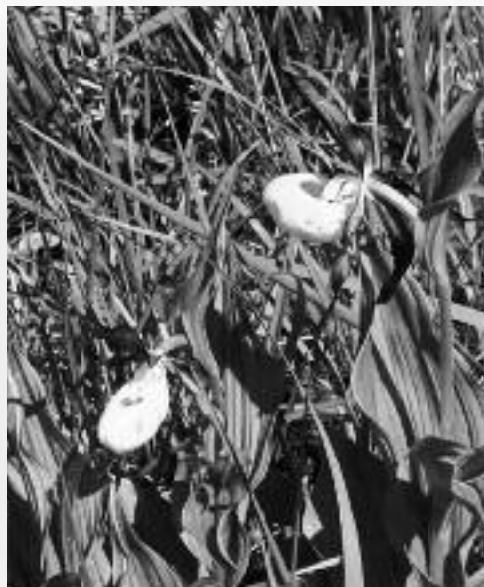
Frauenschuh bei Sonnenschein am 8. Juni 2013