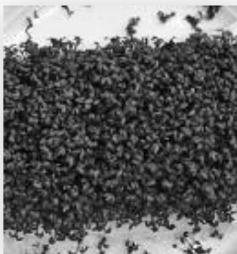
Links: Gesunde Kresse