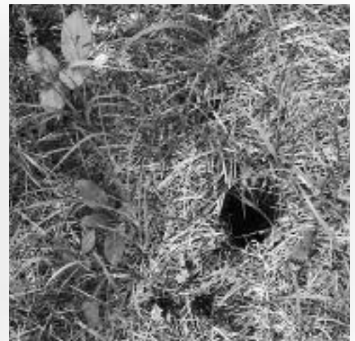
Das macht wütend: Eine Frauenschuh-Pflanze, die außerhalb des Zauns stand, wurde zwischen dem 1. und 8. Juni ausgegraben. Fridolin Schwarz hat so etwas schon öfter feststellen müssen.