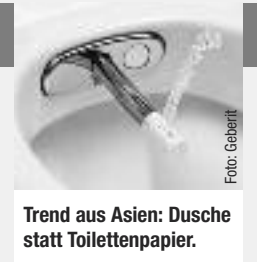
Trend aus Asien: Dusche statt Toilettenpapier.