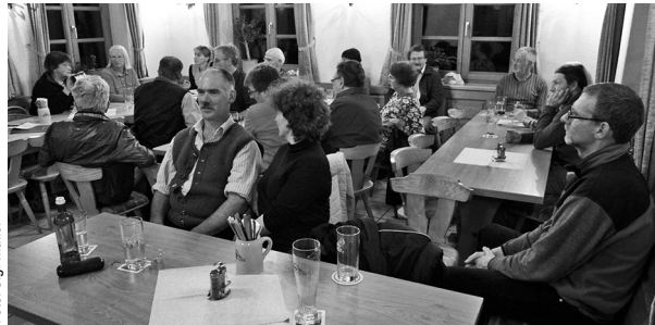
Die Jahreshauptversammlung war gut besucht.

die UIP auch bei Facebook zu finden. Wer „Gefällt mir“ anklickt, wird über die dort neu veröffentlichten Umweltnachrichten informiert und kann selbst Beiträge posten oder teilen. OHA-Leserinnen und -Leser können sich jeden Monat auf drei Seiten über die UIP informieren. Seit Herbst ist die UIP eines von 13 Mitgliedern im „Anti-TTIP-Bündnis Weilheim-Schongau“.