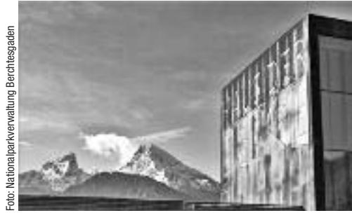
Das im Mai 2013 eröffnete „Haus der Berge“

Das Hochwasser hat den Klausbach modelliert. Nur der Fahrweg wurde freigehalten, damit der privat betriebene „ALM-Erlebnisbus“ hinauffahren kann bis zur österreichischen Grenze am Hirschbichl.